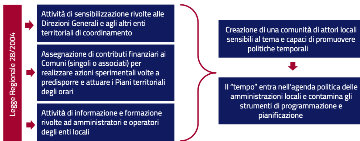
Figura 1. La strategia di Regione Lombardia a supporto delle politiche temporali

Infine, la legge regionale ha previsto l'avvio di attività di formazione dedicate agli operatori impegnati nella progettazione dei PTO e ai componenti degli Uffici tempi costituiti all'interno delle amministrazioni locali.